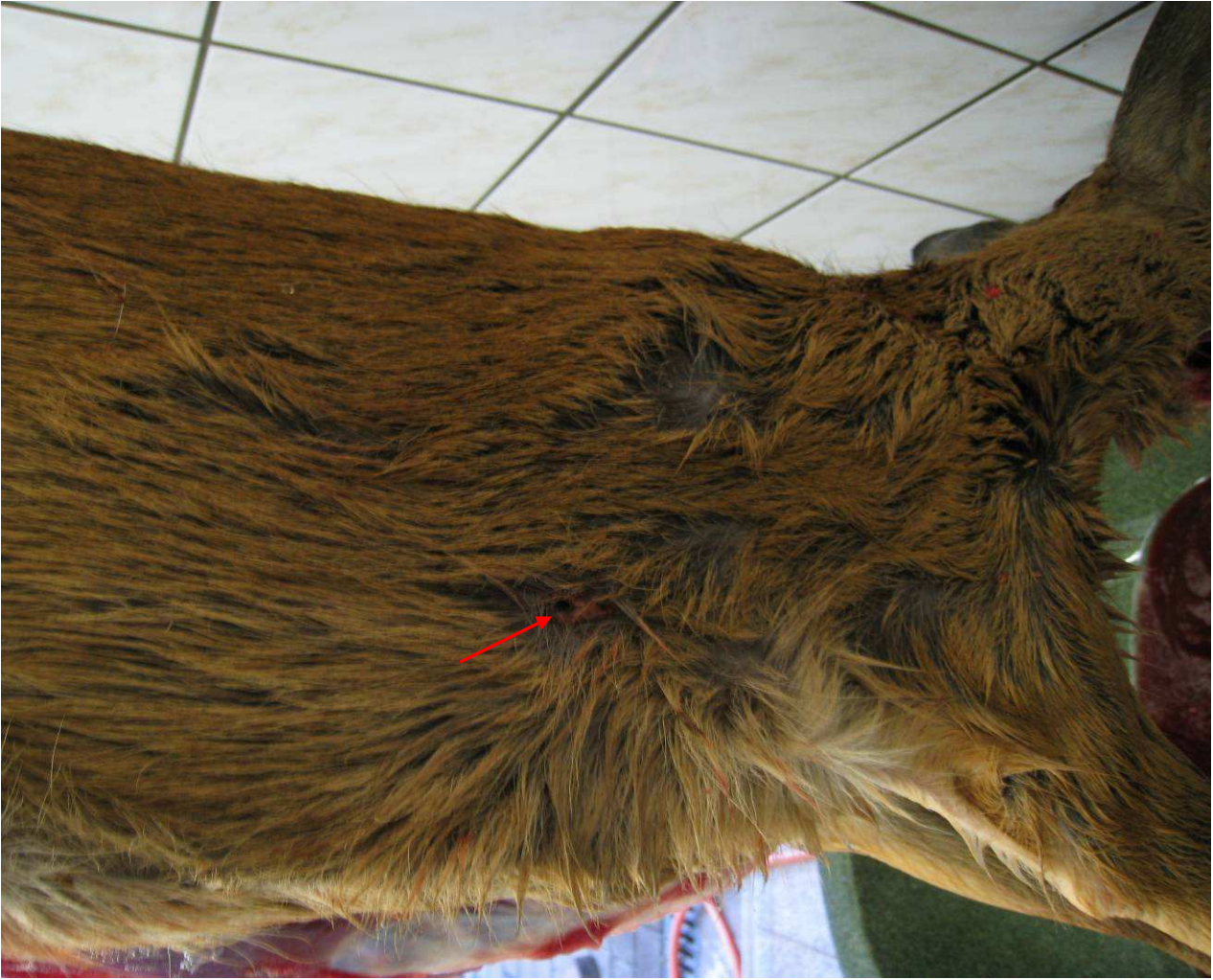
Nach dem Aufbrechen in der Wildkammer. Hier noch einmal der Einschuss.