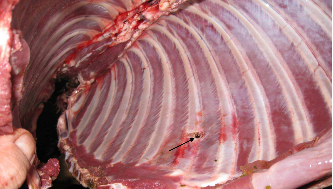
Einschuss, Kammer innen. Eine Rippe am Rand getroffen.