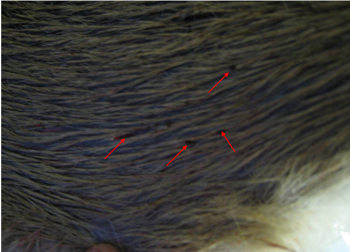
Ausschuss-Seite außen. Bei genauer Betrachtung findet man die vier kleinen Ausschüsse.