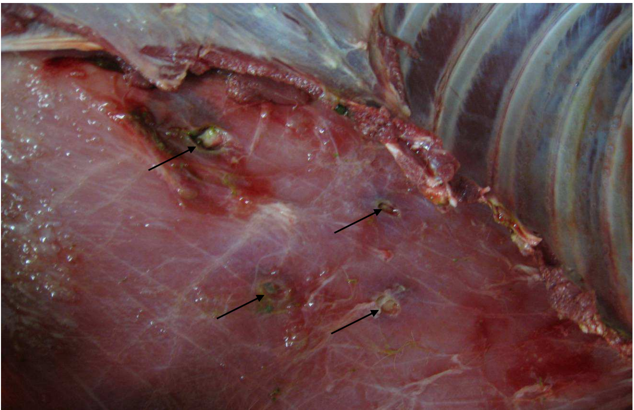
Ausschuss-Seite, innen. Insgesamt vier Projektilteile verursachen Ausschuss im Bereich der letzten kurzen Rippen. Im Bauchraum viel Schweiß, Leber, die fast völlig zerstört ist, und etwas Darminhalt.